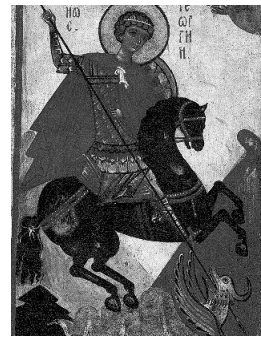
Икона «Святой Великомученик Георгий Победоносец»