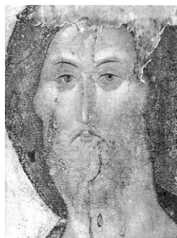
Икона «Спас» Андрея Рублева