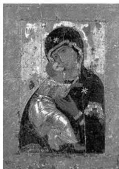
Владимирская Икона Божией Матери